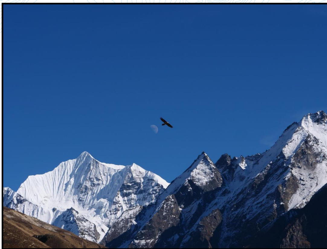
Ganchempo 6387m, vallée du Langtang